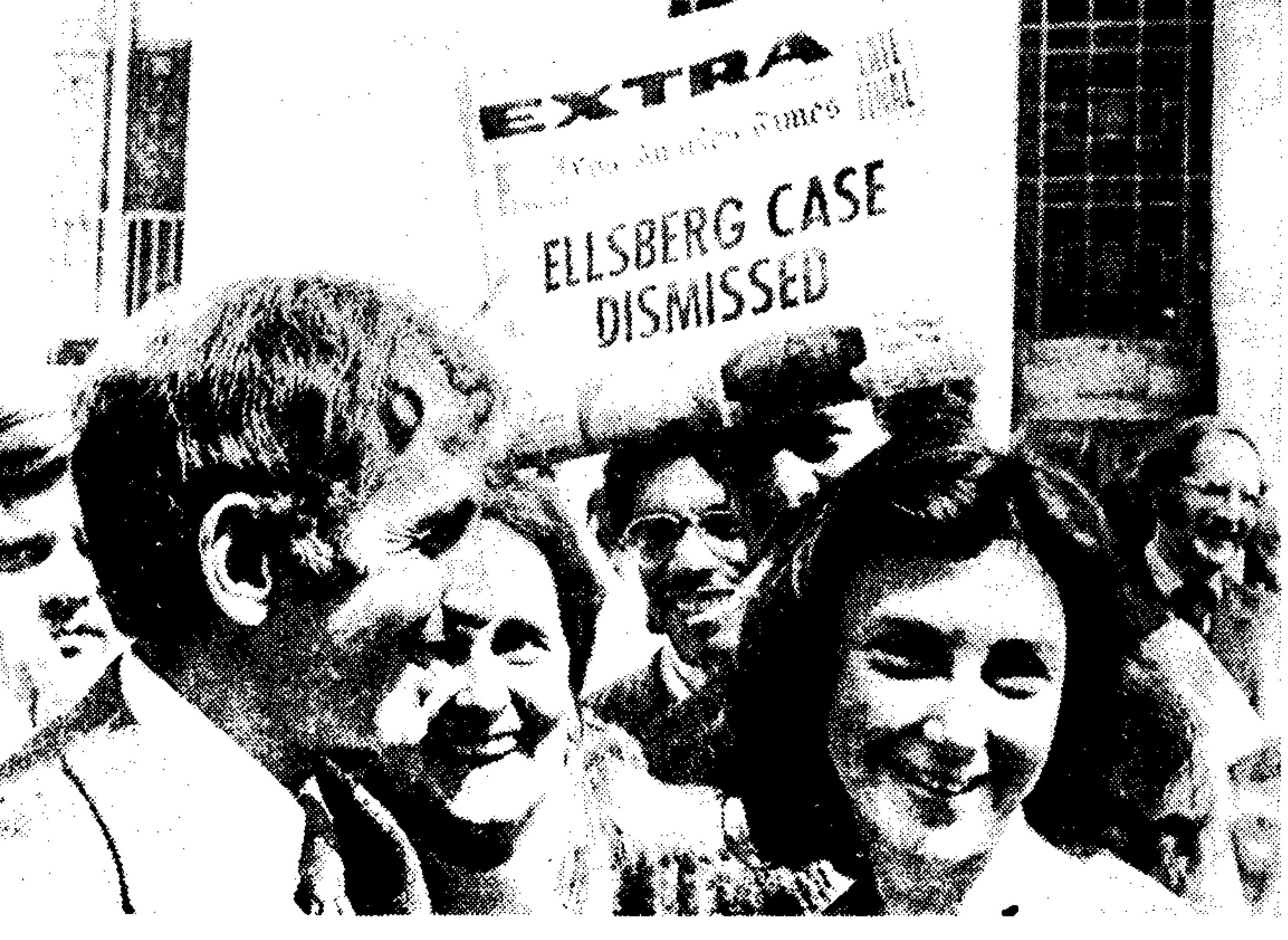
Το αμερικανικό Πεντάγωνο υπέστη χθες μία από τις βαρύτερες ήττες του και το γεγονός αυτό ερμηνεύεται ως προσηλαστική δόξα για την κυβέρνηση Νίξον...