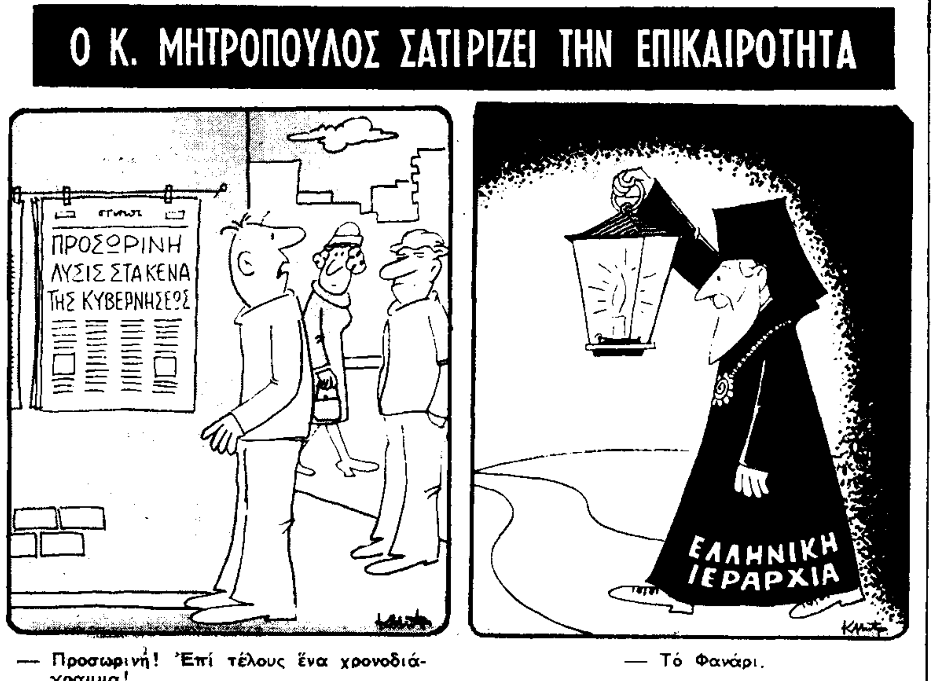
Ο Κ. ΜΗΤΡΟΠΟΥΛΟΣ ΣΑΤΙΡΙΖΕΙ ΤΗΝ ΕΠΙΚΑΙΡΟΤΗΤΑ